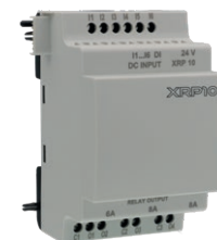
XRP10 Expansión digital 10 I/O