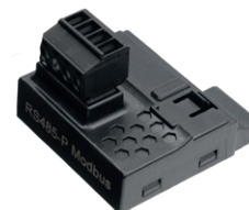
Modbus RS485 P